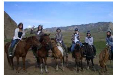
モンゴル文化研修