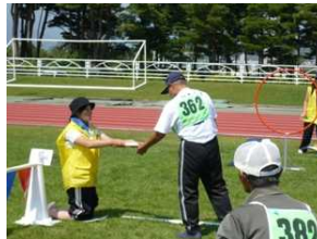
長野県障害者スポーツ大会