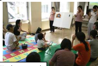
夏休み 子ども遊びのひろば