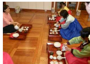
韓国姉妹校交流研修