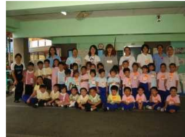
フィリピン文化研修