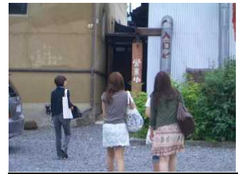
須坂フィールドワーク