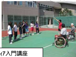
ボランティア入門講座 サンアップルにてミニ体験