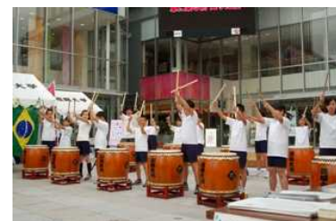
国際交流イベント