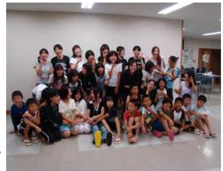
のざわきっず通学合宿

その後、村のケーブルTVで合宿の様子が放映されました。興味のある方は、センターにDVDがありますので、ご覧ください。