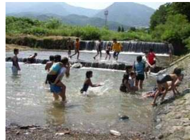
あおきっこ川遊びキャンプ